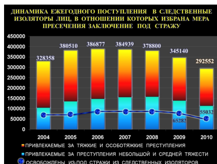
График 1. Численность содержащихся в следственных изоляторах (данные ФСИН)

После внесения изменений в УК РФ по данным ФСИН численность лиц, находящихся в местах лишения свободы и следственных изоляторах, за последние 3 года постоянно падает (график 2). До внесения гуманизирующих поправок в уголовный закон численность таких лиц составляла около 900 тыс., по состоянию на 01.10.2011 – 774,9